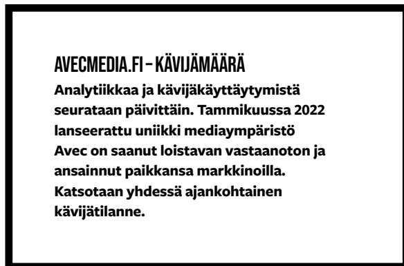
Maksiparaati 980 x 552 px / 300 x 300 px