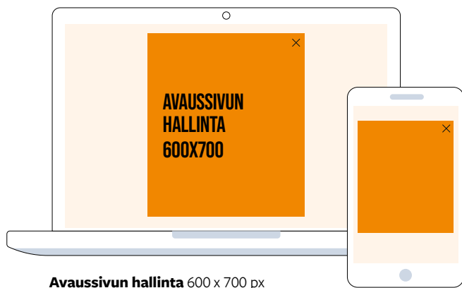
Avaussivun hallinta 600 x 700 px

Avaussivun hallinta avautuu koko ruudun kokoiseksi sisääntulosivuksi kun kävijä saapuu avecmedia.fi-sivustolle. Se skaalautuu päätelaitteen mukaan, joten sillä tavoitetaan kävijät päätelaiterippumattomasti. Toisto 3 kertaa vuorokauden aikana / kävijä / selain.