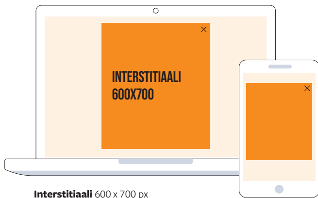
Interstitiaali 600 x 700 px

Interstitiaali eli sisääntulosivu. Interstitiaali avautuu koko ruudun kokoiseksi sisääntulosivuksi kun kävijä saapuu avecmedia.fi-sivustolle. Interstitiaali skaalautuu päätelaitteen mukaan, joten sillä tavoitetaan kävijät päätelaiteriippumattomasti. Toisto 3 kertaa vuorokauden aikana / kävijä / selain.