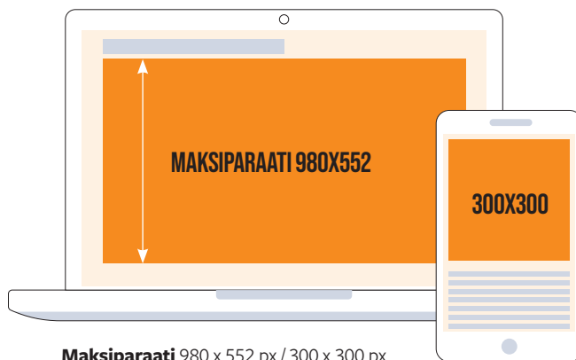
Maksiparaati 980 x 552 px / 300 x 300 px