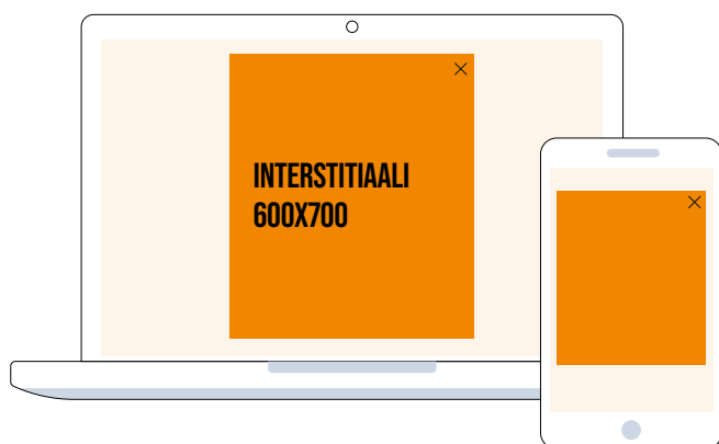
Interstiaali 600 x 700 px

Interstiaali eli sisääntulosivu. Interstiaali avautuu koko ruudun kokoiseksi sisääntulosivuksi kun kävijä saapuu avecmedia.fi-sivustolle. Interstiaali skaalautuu päätelaitteen mukaan, joten sillä tavoitetaan kävijät päätelaiterippumattomasti. Toisto 3 kertaa vuorokauden aikana / kävijä / selain.